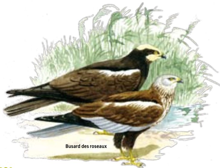
Busard des roseaux

Dans le Parc naturel des Plaines de l'Escaut (Belgique) • 13 SGIB sur 503 ha du territoire (2 %) • 1 site RAMSAR sur 554 ha (2,1 %)