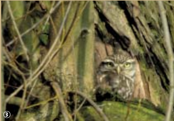
Chouette chevêche d'Athènes

Si avoir les pieds dans l'eau ne vous pose pas de problème particulier, vous pouvez donc vous aventurer dans le secteur des marais !