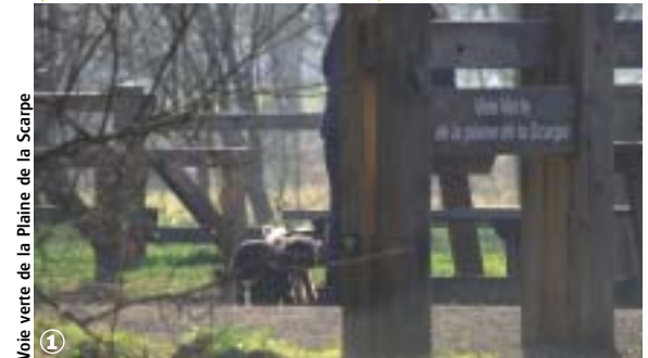
Voie verte de la Plaine de la Scarpe