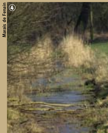
Marais de Fenain

Alors, munis de bottes, de jumelles, de loupes ou de tout autre matériel permettant d'observer, de près ou de loin, faune et flore du secteur, lancez-vous à la découverte du marais. Dans tous les cas, au contact de la nature, l'essentiel est d'ouvrir l'œil et le bon !