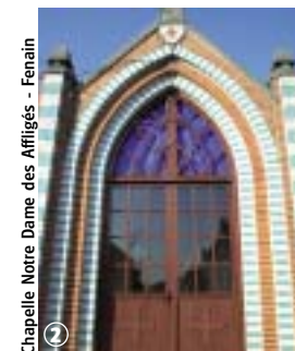
Chapelle Notre Dame des Affligés - Fenain

Vous voici au départ d'un agréable circuit qui vous emmènera au cœur des marais de Fenain en passant par l'ancienne voie ferrée réhabilitée en Voie Verte de la Plaine de la Scarpe. Ce parcours est sans difficulté.