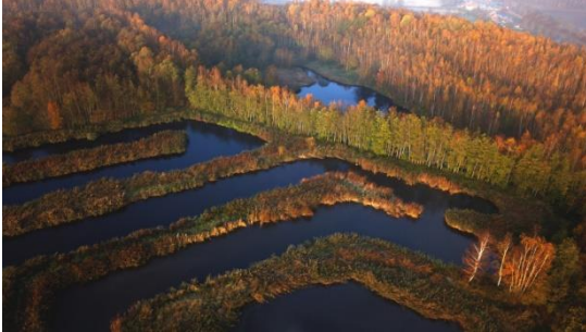
« Alignement rectiligne dans la station expérimentale par lagunage naturel » Terril de Germinies Sud à Lallaing – Valentin Tournay