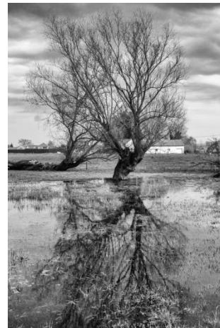
« Saules les pieds dans l'eau » Flines-les-Mortagne – Patricia Dutrieu 1 er prix