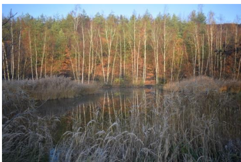
« Gelée matinale – Les Argales » Rieulay – Jean-François Clochard