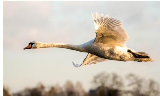
« Cygne tuberculé en vol sur l'étang de Chabaud Latour » Condé-sur-l'Escaut – Nicolas Leport