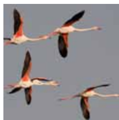
Photos : Grand tétaras, Tortue luth, Phoque veau marin, Lis martagon, Drosera à feuilles rondes et Flamant rose

Les Parcs naturels régionaux abritent de nombreuses espèces végétales et animales emblématiques. Mais cette biodiversité « remarquable » ne doit pas occulter l'importance de la biodiversité associée aux paysages du quotidien, qui joue un rôle essentiel pour le bon fonctionnement des écosystèmes.