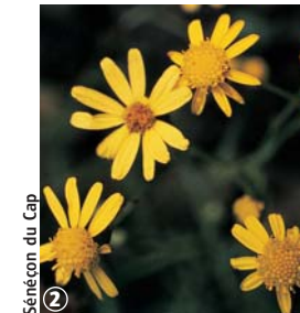
Sénéçon du Cap

L'avis du randonneur : Deux circuits faciles à découvrir toute l'année en famille ou entre amis.