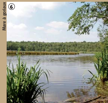
Mare à goïnaux

En effet, un simple courant d'air est aujourd'hui à l'origine, entre autres, du verdissement du terril, et comme il n'a pas fait les choses à moitié, il a apporté des espèces tropicales qui se sont parfaitement