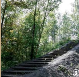
Ascension du terril

Le Terril de Sabatier culmine à plus de 100 m de haut. Il est l'un des vestiges de l'exploitation minière dans le territoire du Hainaut. Il appartient à la catégorie des terrils coniques, c'est-à-dire que les roches autres que le charbon ont été déversées sur son flanc, augmentant ainsi sa superficie au détriment de la forêt.