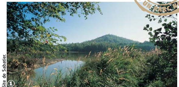
Site de Sabatier.

Randonnée Pédestre Circuits de Sabatier, la forêt, le terril : forêt : 1,6 km / terrill : 3,4 km